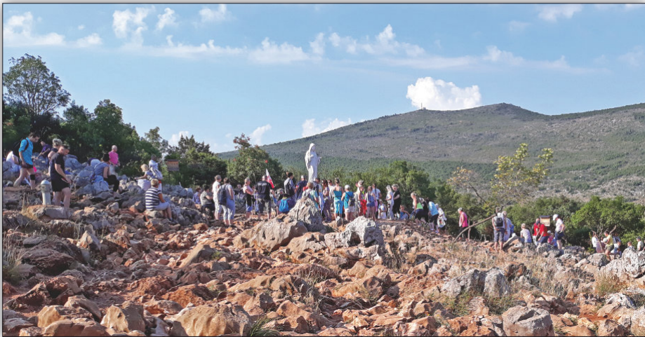
Pielgrzymi na „Górze Objawień” w Medjugorje

Potęga działania Bożego Miłosierdzia w Medjugorje ujawnia się poprzez atmosferę wszechobecnej modlitwy w kościele i poza kościołem. Świadczą o tym kolejki przy konfesjonałach i rozbrzmiewające na wzgórzach modlitwy nieustannie przybywających pielgrzymów z najdalszych zakątków świata, pragnących poznać i doświadczyć