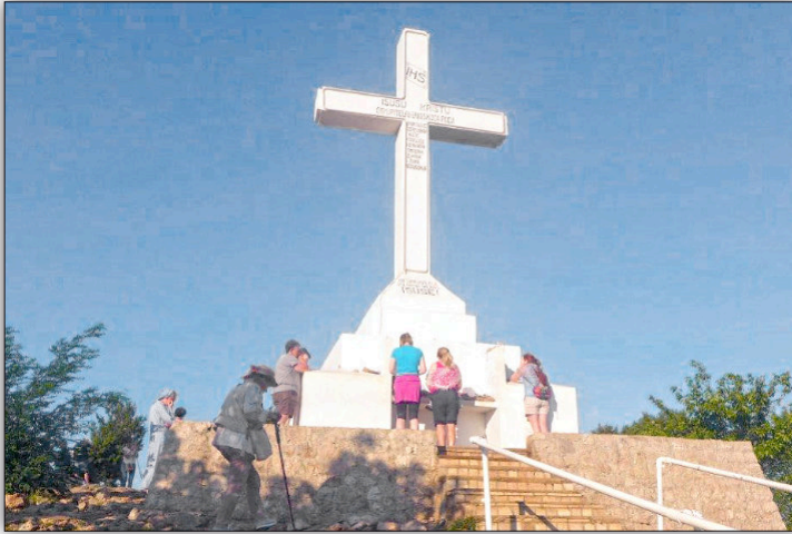
Góra Krzyża w Medjugorie