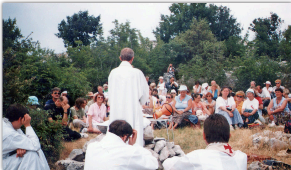
Rekolekcje w drodze do Medjugorie