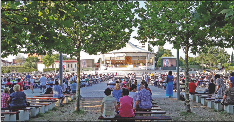
Pielgrzymi przy kościele św. Jakuba w Medjugorje