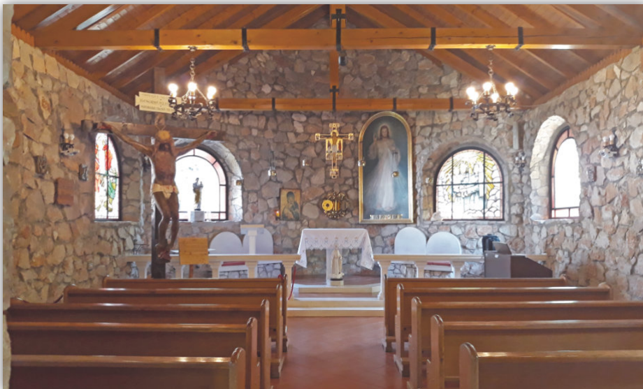
Kaplica w „Oazie Pokoju”

Odczuwając ulgę i radość, po dwóch dniach udałam się pod „Błękitny Krzyż”, aby podziękować Bogu za wszystko, co się dokonało. Będąc sama, mogłam spokojnie przeanalizować cały przebieg emocjonujących wydarzeń z obrazem. Cieszyłam się z pomyślnego zakończenia sprawy nie przeczuwając, że był to dopiero początek mojej trudnej wieloletniej posługi.