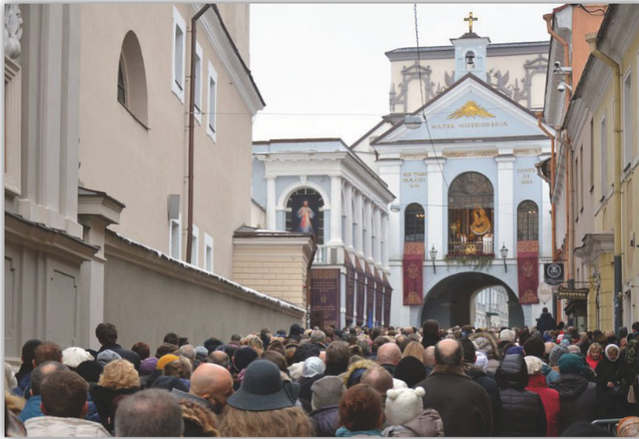
Obraz Jezusa Miłosiernego wystawiony w Ostrej Bramie w czasie uroczystości Święta Bożego Miłosierdzia. Widok współczesny.