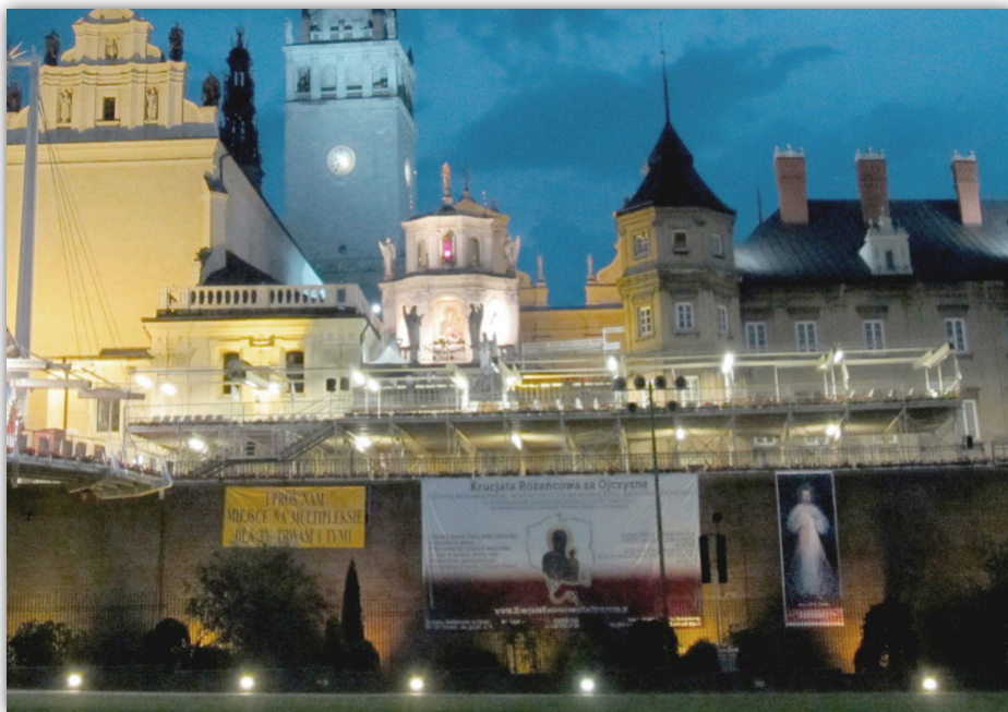
Obraz Jezusa Miłosiernego na Wałach Jasnogórskich