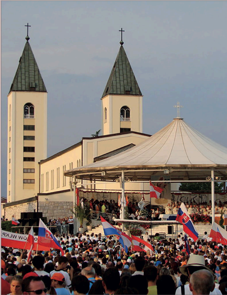
Medjugorie, kościół pw. Świętego Jakuba

„Jest to jedno z najbardziej żywych miejsc modlitwy i nawróceń w Europie...”